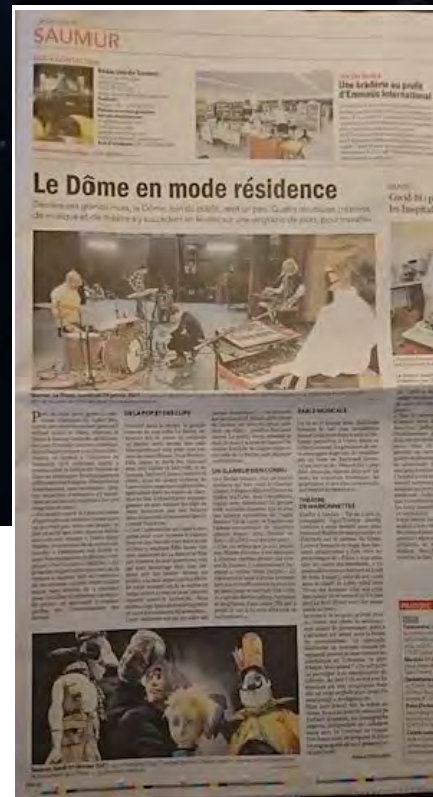
Résidence au Dôme Théâtre de Saumur. (Février 2021)

"La marionnette, c'est du concentré de théâtre, c'est st le théâtre absolument nucléaire. La marionnette imite l'homme et l'homme imite la marionnette." Ariane Mnouchkine. Mettre en scène 2009.